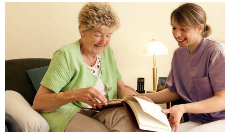
Wer einen Angehörigen wöchentlich für mindestens 14 Stunden pflegt, gilt als Pflegeperson.

Der Beitrag zur freiwilligen Weiterversicherung ist allein von der Pflegeperson zu tragen. Zur Inanspruchnahme von Pflegezeit siehe unter Punkt 3.2 a.