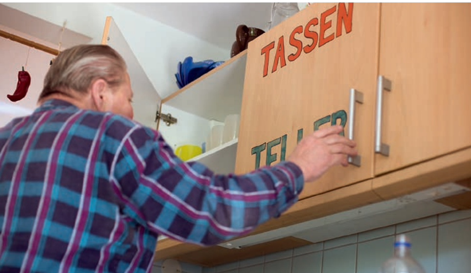
Demenziell erkrankte Menschen benötigen Orientierungshilfen im Alltag.

können verschiedene Hilfen bei der Alltagsgestaltung fallen, zum Beispiel Spazierengehen oder Vorlesen. Das ist insbesondere für die demenziell erkrankten Menschen und ihre Angehörigen eine große Erleichterung. Der Anspruch auf häusliche Betreuung setzt voraus, dass die Grundpflege und hauswirtschaftliche Versorgung im Einzelfall sichergestellt sind.