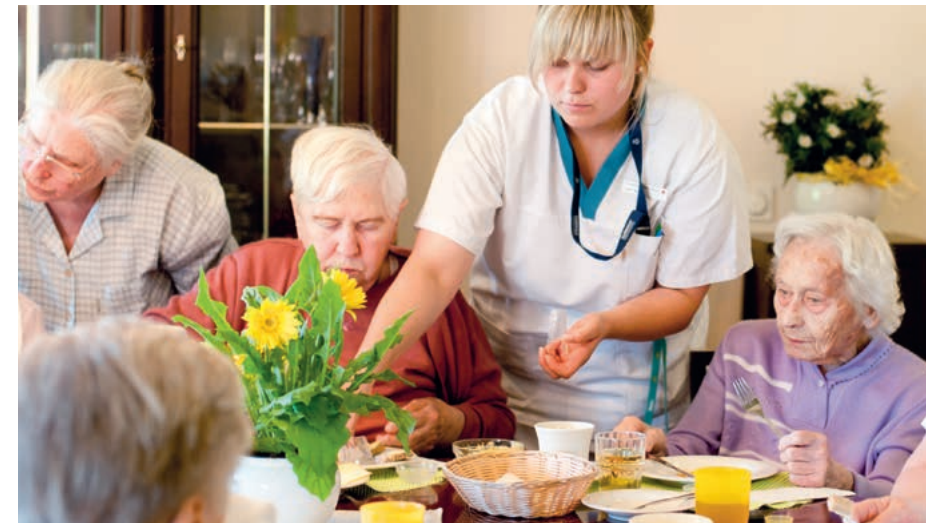
Neue Wohnformen – wie Senioren-WGs – werden durch die Pflegereform gefördert.

Jeder Pflegebedürftige, der sich an der Gründung einer ambulant betreuten Wohngruppe beteiligt, kann bei seiner Pflegekasse im Rahmen dieser Anschubfinanzierung einmalig eine Förderung von bis zu 2.500 Euro beantragen. Je Wohngemeinschaft ist diese Förderung allerdings auf 10.000 Euro begrenzt, bei mehr als vier anspruchsberechtigten Antragstellern wird der Gesamtbetrag anteilig auf sie aufgeteilt. Diese Förderung steht seit 1. Januar 2015 auch Versicherten in der sogenannten „Pflegestufe 0“, beispielsweise demenziell Erkrankten, zur Verfügung. Den Antrag auf Bewilligung dieser Mittel müssen die WG-Mitglieder innerhalb eines Jahres ab Vorliegen der Anspruchsvoraussetzungen stellen. Die Bestimmungen zu den Einzelheiten und zur Verfahrensweise sind bei den Pflegekassen zu erfahren.