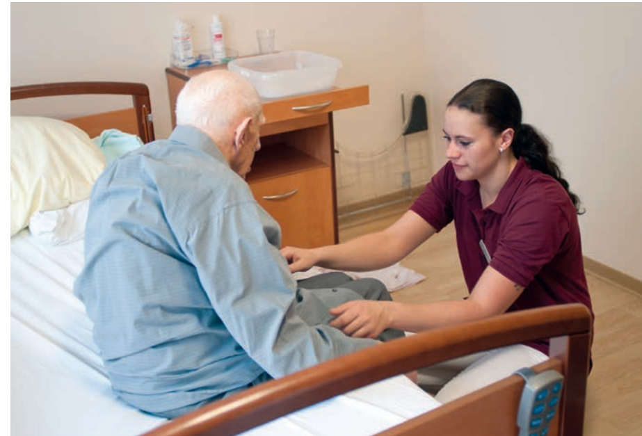
Pflegebedürftige, die aus dem Krankenhaus entlassen werden, sind auf besondere Betreuung angewiesen.