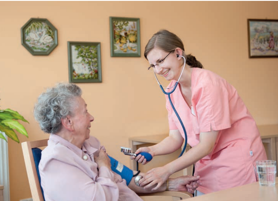
Auch in Wohngemeinschaften besteht Anspruch auf häusliche Krankenpflege.

in der Regel die Grund- und Behandlungspflege (zum Beispiel Verbandswechsel) sowie die hauswirtschaftliche Versorgung im erforderlichen Umfang. Häusliche Krankenpflege in Form von Behandlungspflege wird auch dann erbracht, wenn sie zur Sicherung des Ziels der ärztlichen Behandlung erforderlich ist. Die Krankenkasse kann zusätzlich zu leistende Grundpflege und hauswirtschaftliche Versorgung vorsehen und deren Umfang und Dauer bestimmen. Diese zusätzlichen Satzungsleistungen dürfen allerdings nach Eintritt von Pflegebedürftigkeit im Sinne der Pflegeversicherung nicht mehr von den Krankenkassen übernommen werden, da sie dann zum Aufgabenbereich der gesetzlichen Pflegeversicherung gehören. Voraussetzung: Im Haushalt leben keine Personen, die die Pflege im erforderlichen Umfang übernehmen können.