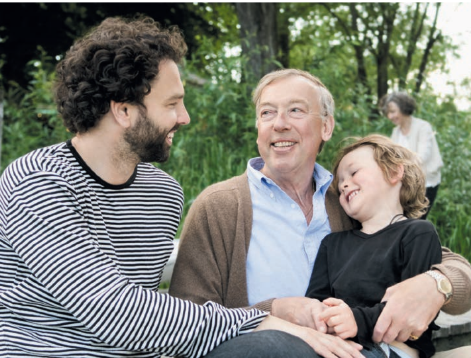
Wer Kinder hat, zahlt geringere Beiträge als Kinderlose.

Der Beitragssatz lag bis zum 31. Dezember 2014 bei 2,05 Prozent des Bruttoeinkommens, bei kinderlosen Beitragszahlerinnen und Beitragszahlern bei 2,3 Prozent. Seit dem 1. Januar 2015 liegt der Beitragssatz bei 2,35 Prozent, bei Kinderlosen bei 2,6 Prozent.