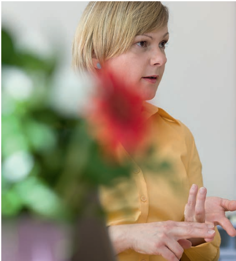
Der Beitrag in der sozialen Pflegeversicherung ist abhängig vom Einkommen.

Die Zahlung des Beitragszuschlags erfolgt im Rahmen des für den Pflegeversicherungsbeitrag üblichen Beitragseinzugsverfahrens. Die beitragsabführende Stelle (also zum Beispiel der Arbeitgeber vom Arbeitsentgelt oder die Versorgungswerke von den Versorgungsbezügen) behält den zusätzlichen Beitragsanteil in Höhe von 0,25 Beitragsatzpunkten ein und führt diesen zusammen mit dem Gesamtsozialversicherungsbeitrag an die Einzugsstelle ab.