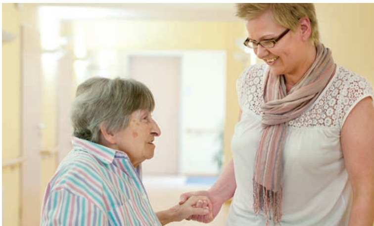
Wer zwei Jahre versichert ist, hat den vollen Anspruch auf Pflegeleistungen.

Zu beachten ist: Erteilt die Pflegekasse den schriftlichen Bescheid über den Antrag nicht innerhalb von fünf Wochen nach Eingang des Antrags oder werden die verkürzten Begutachtungsfristen nicht eingehalten, hat die Pflegekasse nach Fristablauf für jede begonnene Woche der Fristüberschreitung 70 Euro an den Antrag-