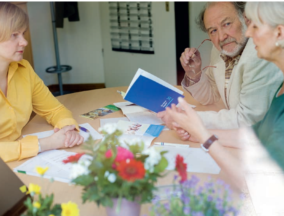
Pflegeberaterinnen und Pflegeberater geben umfassende Auskunft über das vorhandene Leistungsangebot.

In einem Pflegestützpunkt wird die Beratung über und die Vernetzung aller pflegerischen, medizinischen und sozialen Leistungen gebündelt. Der Pflegestützpunkt bildet das gemeinsame Dach, unter dem sich die Mitarbeiterinnen und Mitarbeiter der Pflege- und Krankenkassen, der Altenhilfe oder der Sozialhilfeträger untereinander abstimmen und den Rat und Hilfe suchenden Betroffenen ihre Sozialleistungen erläutern.