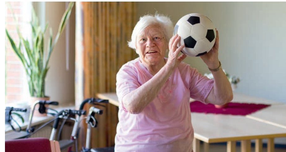
Prävention trägt dazu bei, dass Menschen länger aktiv bleiben können.

Bei Vorsorge- und Rehabilitationsentscheidungen der Krankenkassen sind die besonderen Belange pflegender Angehöriger zu berücksichtigen. Die Pflegenden können die Vorsorge oder Rehabilitation dabei alleine in Anspruch nehmen, zum Beispiel auch, um einmal Abstand zu gewinnen und wieder eine neue Perspektive einzunehmen. Pflegende Angehörige sollen bei einer eigenen Vorsorge- oder Rehabilitationsmaßnahme aber ebenfalls die Möglichkeit haben, den Pflegebedürftigen mitzunehmen. Denn oft sind Angehörige erst dazu bereit, solche Angebote anzunehmen, wenn der Pflegebedürftige in der Nähe sein kann. Für die Versorgung des Pflegebedürftigen in dieser Zeit kann dabei der Anspruch auf Kurzzeitpflege eingesetzt werden. Einrichtungen des Müttergenesungswerks oder gleichartige Einrichtungen können in die Versorgung pflegender Angehöriger im Rahmen der gesetzlichen Krankenversicherung einbezogen werden.