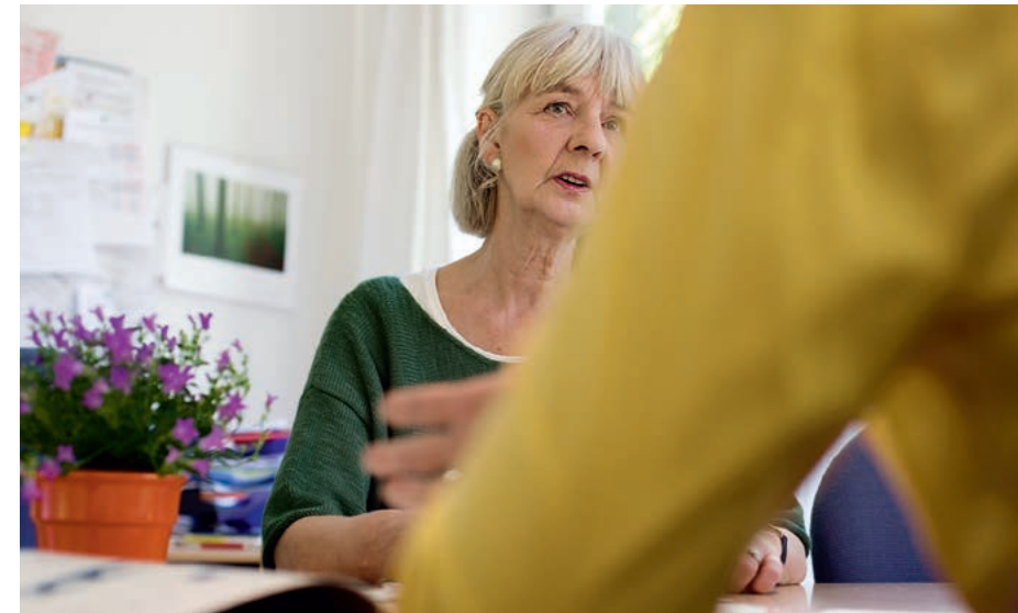
Versicherungspflicht: Alle Bürgerinnen und Bürger müssen sich für den Pflegefall versichern.

Das GKV-Wettbewerbsstärkungsgesetz (GKV-WSG) bezieht außerdem seit dem 1. April 2007 weitere Personen in die Versicherungspflicht in der gesetzlichen Krankenversicherung ein: Wer keine anderweitige Absicherung im Krankheitsfall hat und dem System der gesetzlichen Krankenversicherung zuzuordnen ist, wird dort auch versicherungspflichtig; wer dem System der privaten Krankenversicherung zuzuordnen ist, unterliegt seit 1. Januar 2009 einer Versicherungspflicht in der privaten Krankenversicherung. Im Ergebnis sind somit alle Bürgerinnen und Bürger im Krankheitsfall abgesichert. Die erweiterte Krankenversicherungspflicht hat dabei auch zu einer Einbeziehung von nahezu allen Bürgerinnen und Bürgern in die Pflegeversicherung geführt.