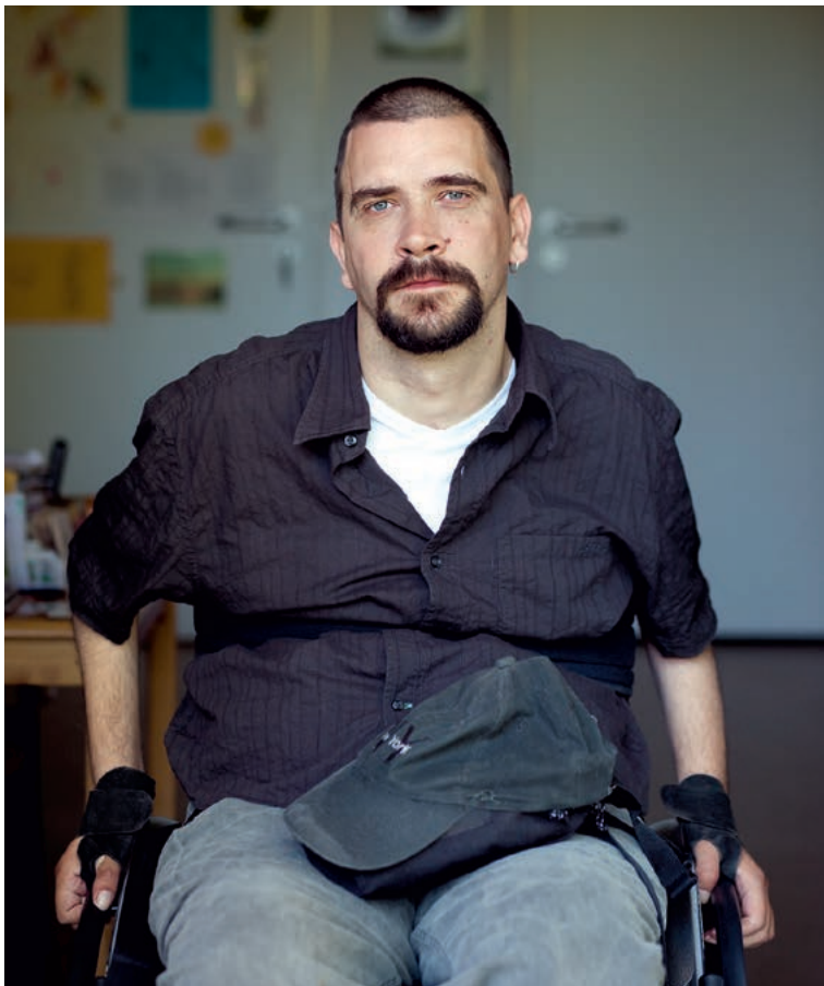
Auch Menschen mit Behinderung sind über die Pflegeversicherung abgesichert.

Der Beitragszuschlag kommt nur für kinderlose Menschen mit Behinderung in Betracht, die eigenständiges beitragspflichtiges Mitglied der sozialen Pflegeversicherung sind. Menschen mit Behinderung sind nach geltendem Recht sowohl in der gesetzlichen Krankenversicherung als auch in der Pflegeversicherung über