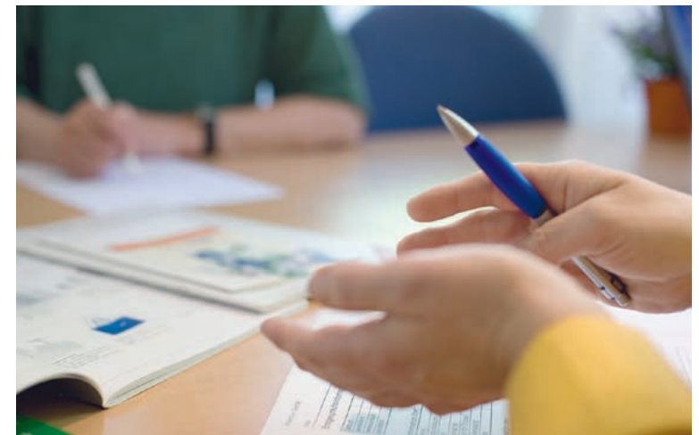
Seit dem 1. Januar 2013 wird die private Pflegezusatzversicherung staatlich gefördert.

Die Zulage beträgt in diesem Fall monatlich 5 beziehungsweise jährlich 60 Euro. Sie wird dem Versichertenvertrag automatisch gutgeschrieben, ohne dass sich der Versicherte darum kümmern muss.