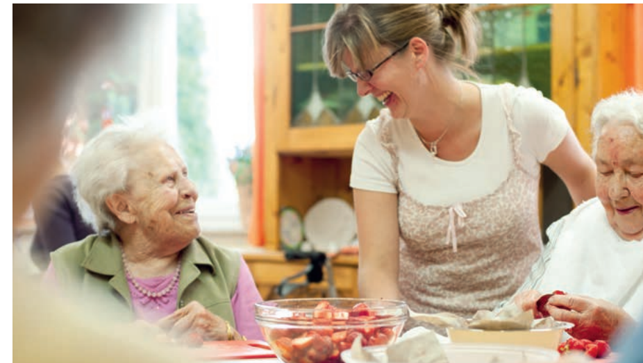
Wer sich ehrenamtlich in der Pflege engagiert, erhält Unterstützung von den Pflegekassen.

Betreuung der Pflegebedürftigen oder erheblich in der Alltagskompetenz eingeschränkten Personen unterstützen, eine Aufwandsentschädigung zu zahlen und Schulungen anzubieten. Hierfür anfallende zusätzliche Aufwendungen werden bei der Vergütung der Einrichtungen durch die Pflegekassen berücksichtigt. Darüber hinaus können Personen, die sich für eine ehrenamtliche Pflege Tätigkeit interessieren, auch kostenlos an den Pflegekursen der Pflegekassen teilnehmen.