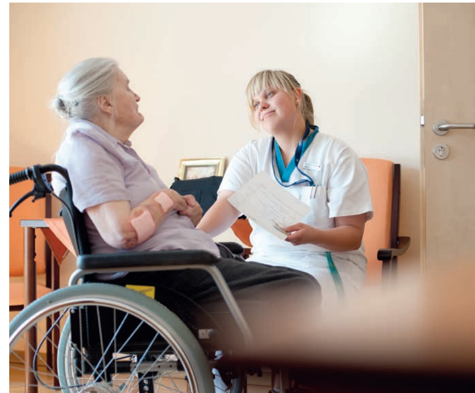
Pflegebedürftige Menschen haben einen Anspruch auf gute Beratung.

Die Inanspruchnahme der Pflegeberatung ist freiwillig. Es ist selbstverständlich, dass keine bestimmte Beratungsperson aufgezwungen oder vorgeschrieben werden kann. Bei Problemen mit Ihrer Pflegeberaterin oder Ihrem Pflegeberater sind klärende Gespräche in den Pflegestützpunkten eine Möglichkeit, eventuelle Missverständnisse auszuräumen. Darüber hinaus steht die Pflegekasse jederzeit zur Verfügung, um Abhilfe zu schaffen.